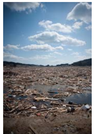
360度、どこまでも続く瓦礫の平野